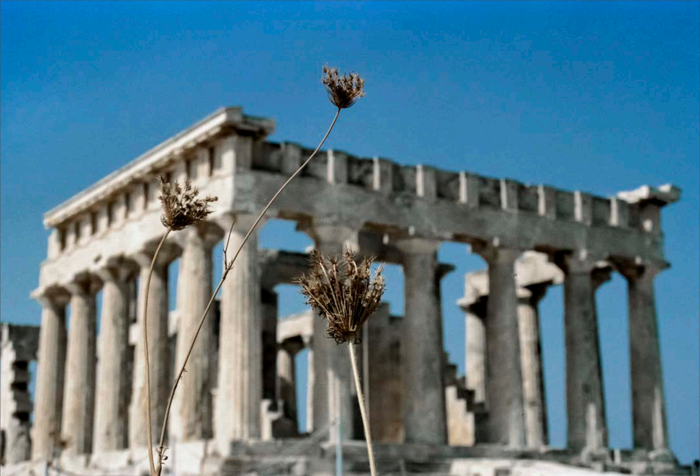
Temple d'Aphaïa Île d'Égine, Grèce