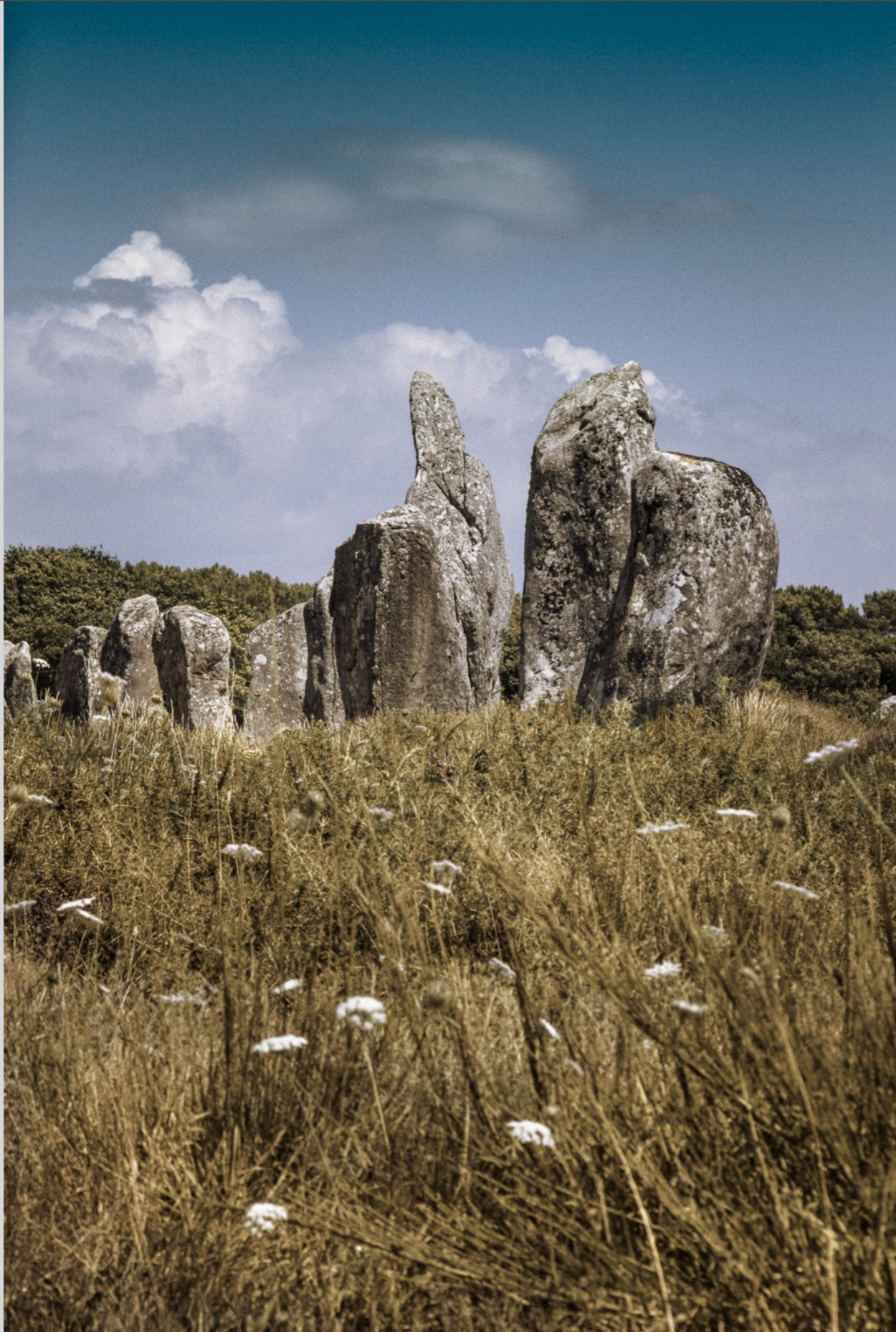
Carnac Bretagne, France