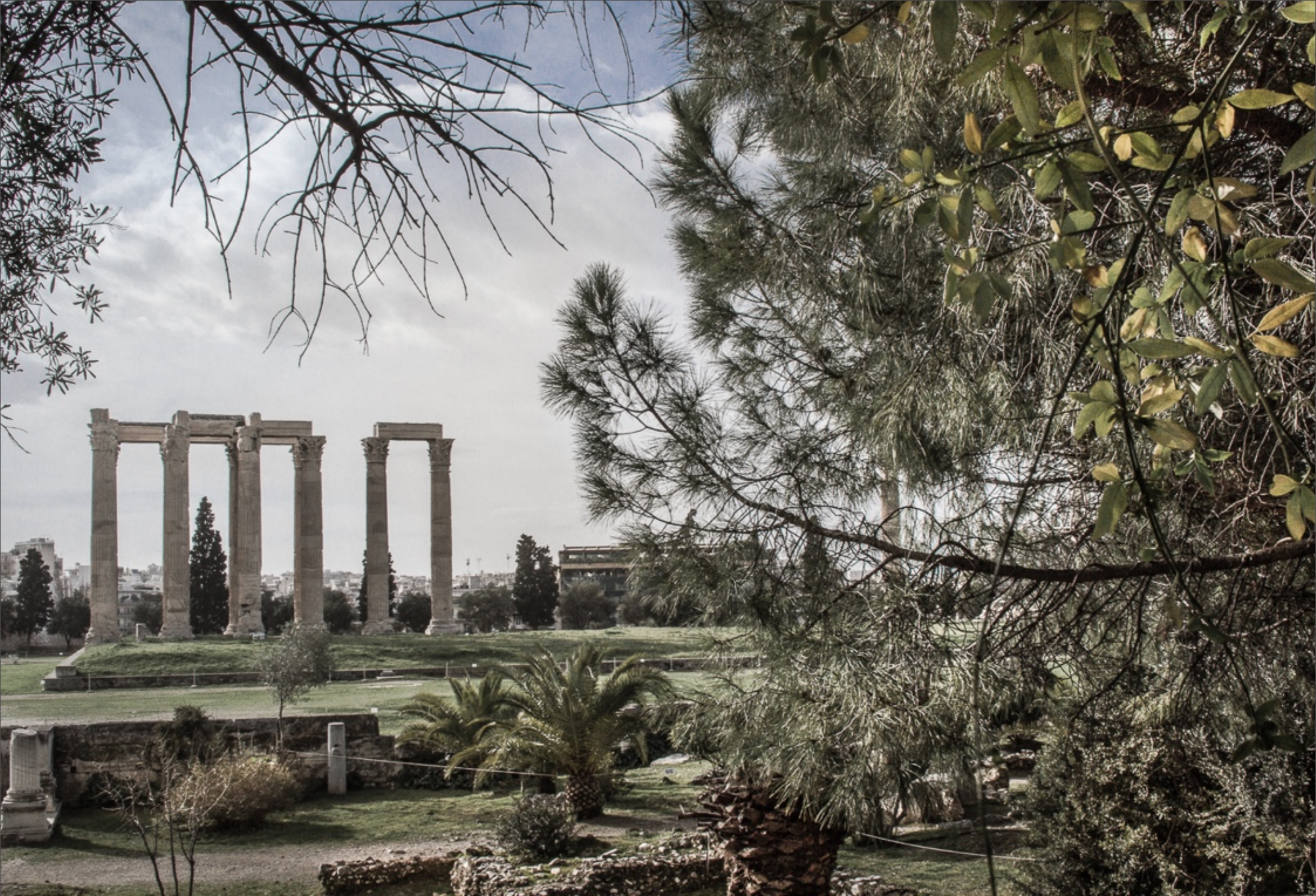
Temple de Zeus Athènes, Grèce