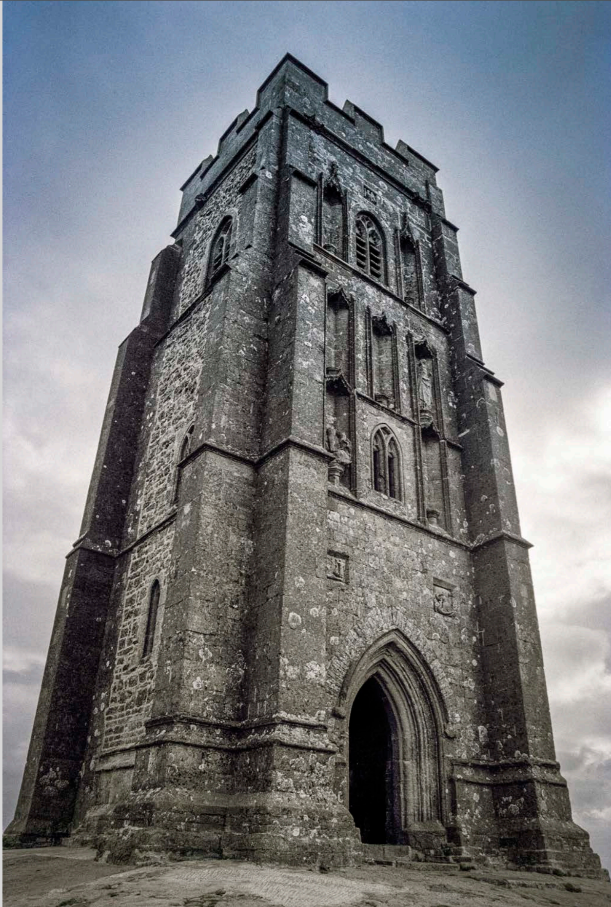
Glastonbury Tor Somerset, Angleterre