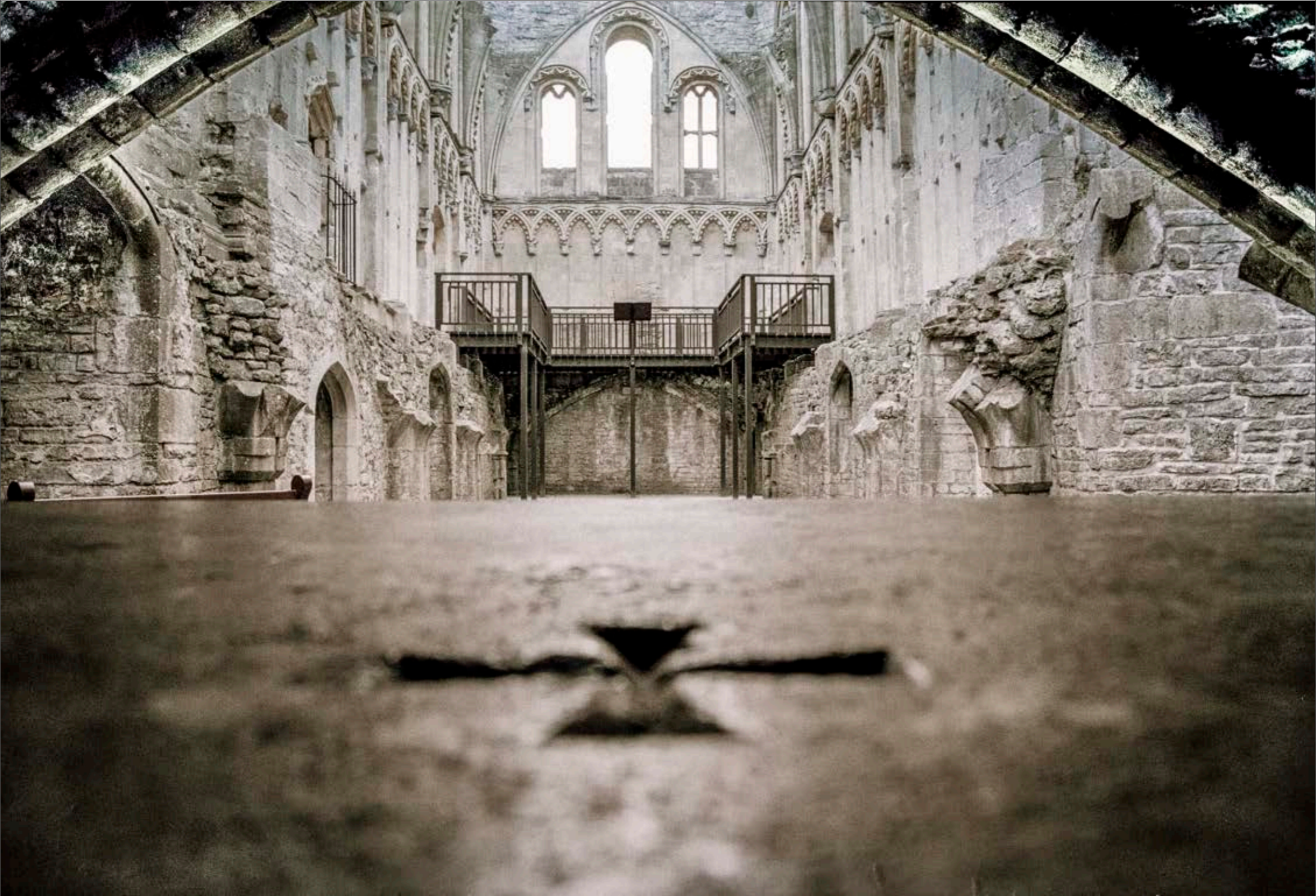
L'autel de l'Abbaye de Glastonbury Somerset, Angleterre