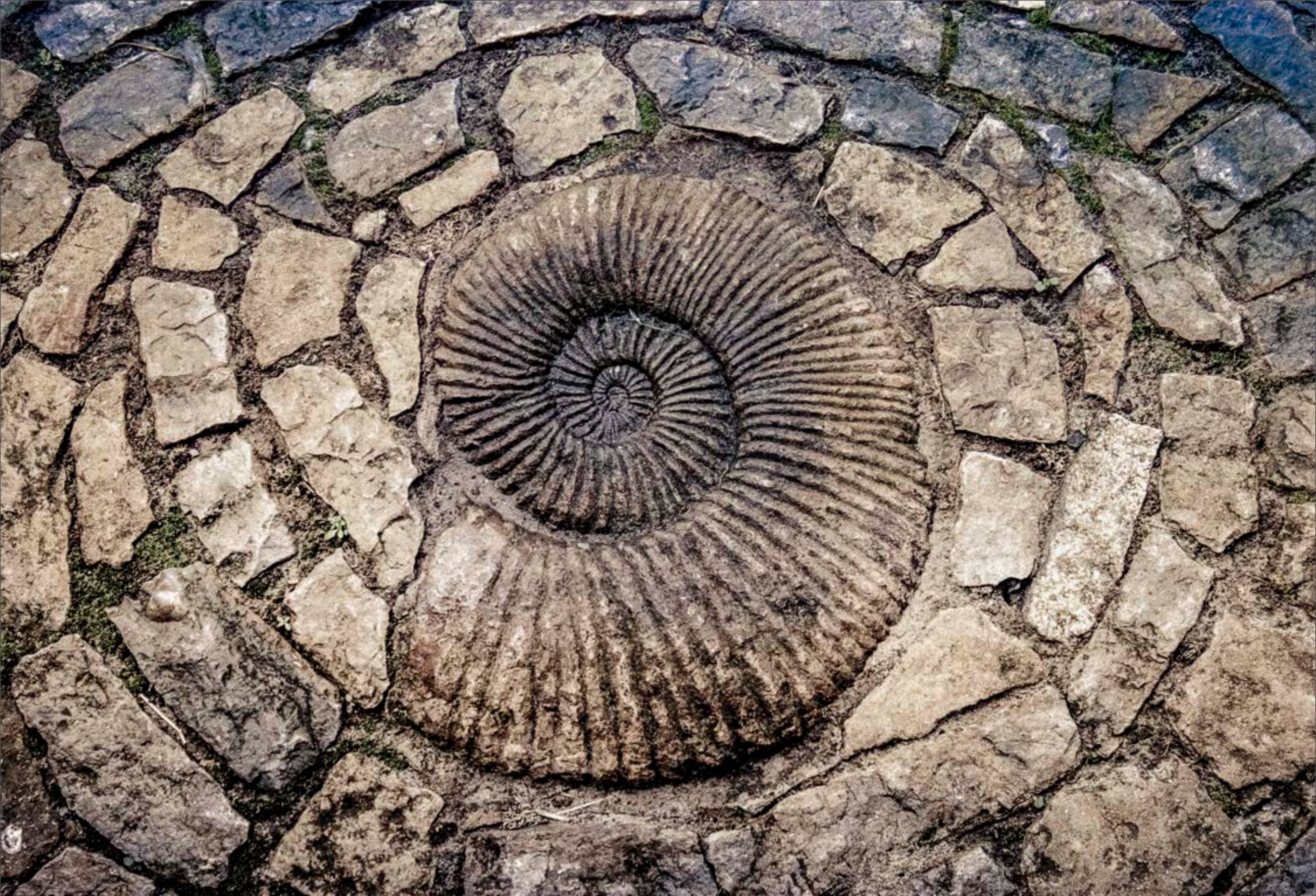
Jardins du Chalice Well Glastonbury, Angleterre