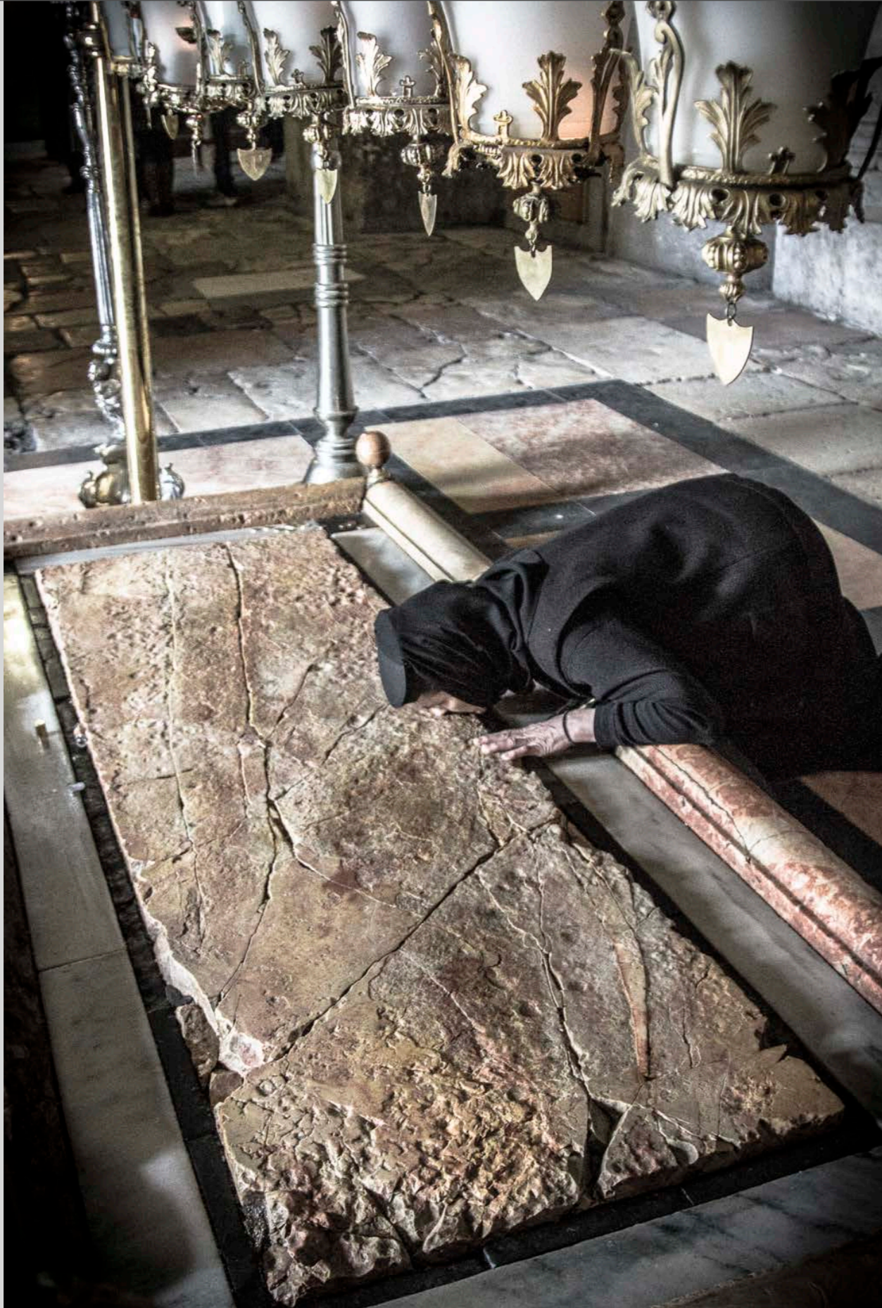
Église du Saint-Sépulcre Jérusalem, Israël/Palestine