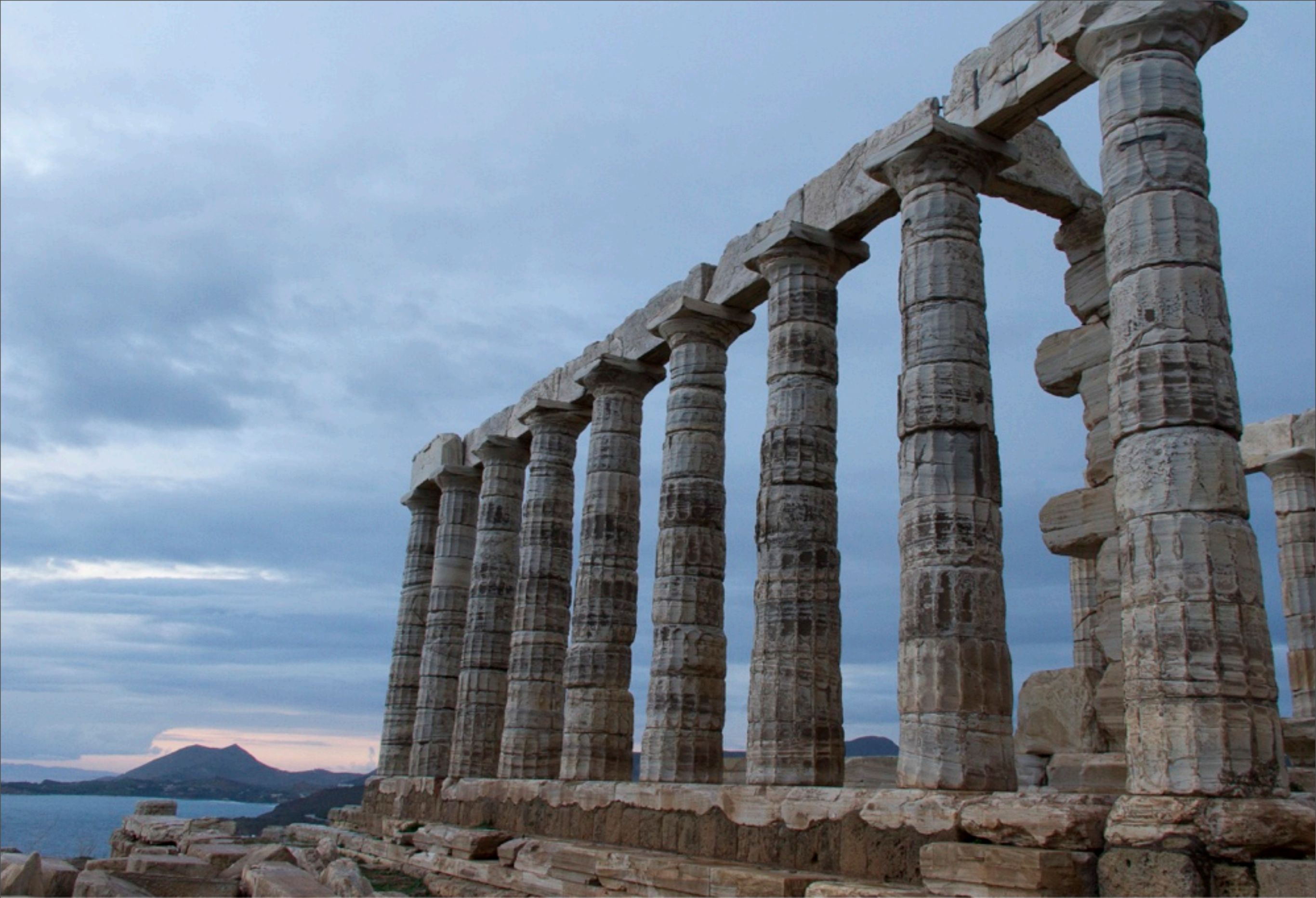
Temple de Poséidon Cap Sounion, Grèce