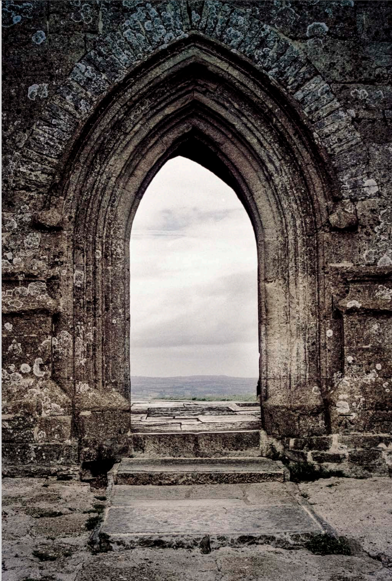
Portail, Glastonbury Tor Somerset, Angleterre